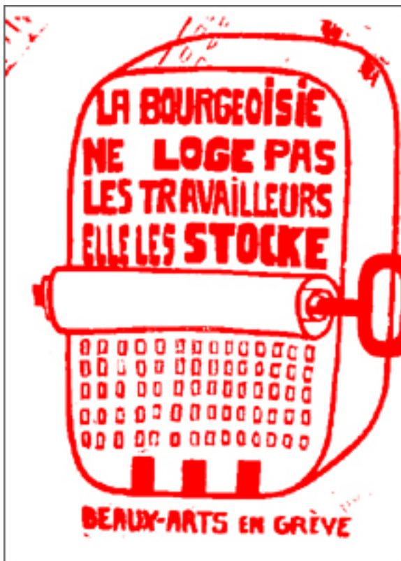
1968 - Atelier Populaire